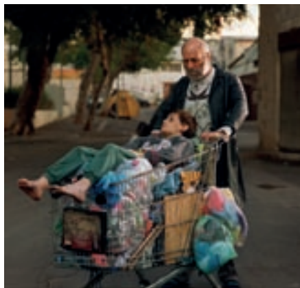
Adi Nes, Biblical Stories (Abraham & Isaac) , 2004. Photographie, 140 x 140 cm.

Marché aux livres Catalogues et livres d'art à prix réduit dans l'Aquarium du Casino Luxembourg.