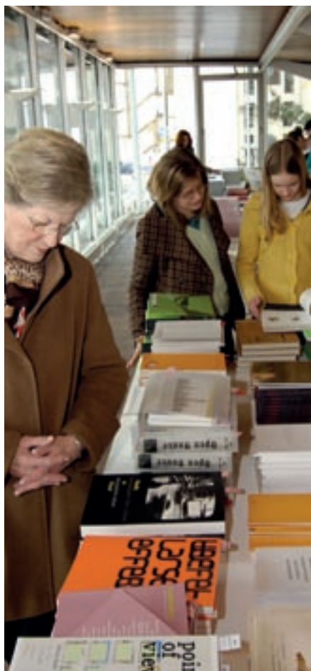
Marché aux livres au Casino Luxembourg.