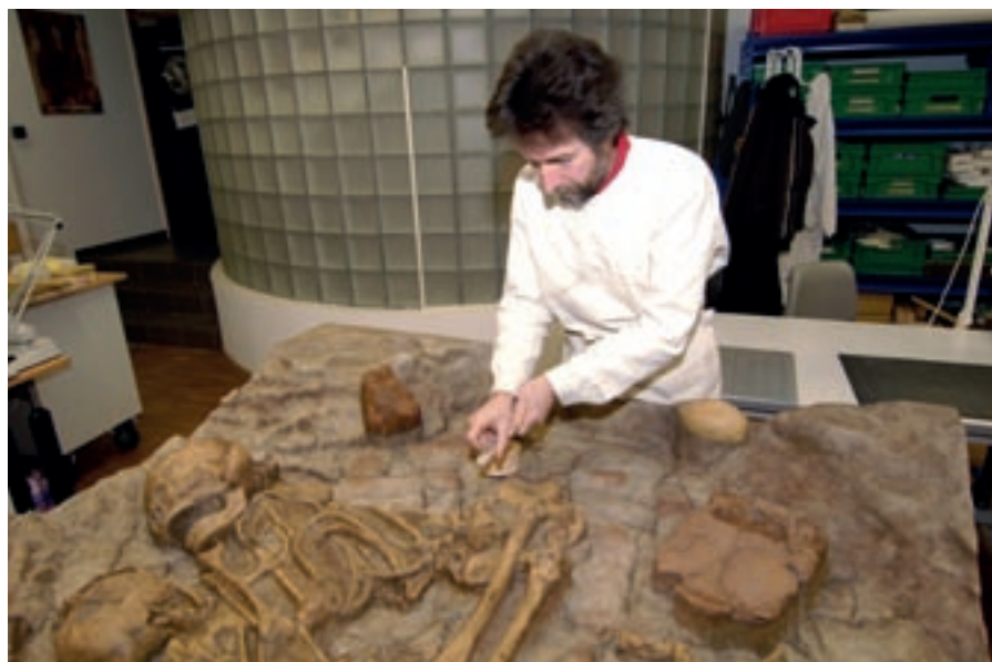
Facsimile du double ensemble funéraire d'Altwiess, ici en préparation pour une exposition prévue par le MNHA en 2011. Il s'agit de l'ensemble funéraire provenant de la fin de l'âge de la pierre polie, sans doute le mieux conservé en Europe.

Collectionner, restaurer, conserver, étudier, exposer et transmettre : ainsi peuvent donc se résumer les missions clés d'un musée moderne. Le point de départ, c'est la collection, sans elle il n'y a pas de musée. Elle n'est cependant pas un but en soi, mais le fondement de tout travail muséologique à proprement parler. L'étude scientifique des collections fait elle aussi partie intégrante du cahier des charges d'un musée moderne.