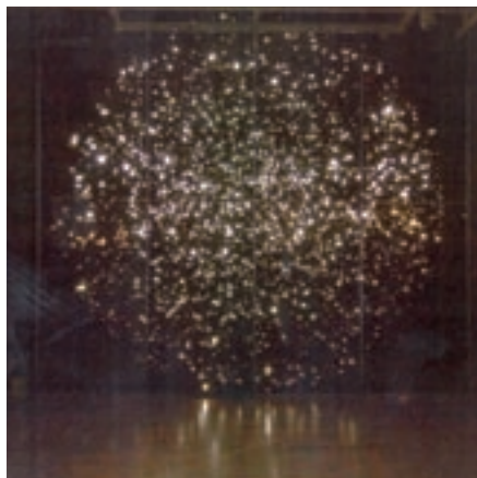
Aude Moreau, Tirer le ciel , 2005 Intervention / Installation