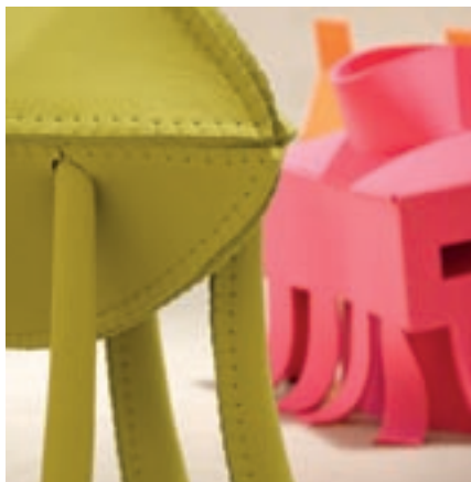
Vue de l'exposition Laure Tixier: Plaid Houses

Commissaire : Christoph Keller Scénographie : Martino Gamber Partenaire de l'exposition : Colophon asbl