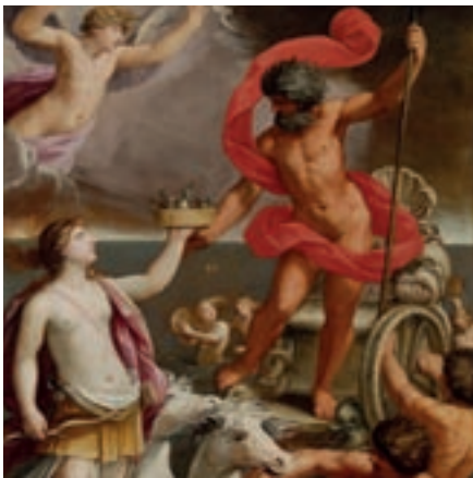
G. A. Sirani, La Terre donne à Neptune les bulbes de la tulipe , huile sur toile, 155 x 119 cm (Banca Popolare dell'Emilia Romagna)

En 1845, la volonté d'historiens et d'archéologues désireux de préserver les témoignages historiques et artistiques de leur pays aboutit à la fondation de la « Société pour la recherche et la conservation des monuments historiques dans le Grand-Duché de Luxembourg », devenue en 1868 la « Section historique » de l'Institut Grand-Ducal. Ce n'est qu'en 1919 qu'un concours pour la construction d'un musée national fut lancé. Le musée a finalement été aménagé dans la maison Collart-de-Scherff au Marché-aux-Poissons, que l'État avait acquis à cette fin en 1922. Les Musées de l'État ont ouvert leurs premières salles consacrées à l'archéologie et aux sciences naturelles en 1939. Après la Deuxième Guerre mondiale, les collections se sont agrandies par des acquisitions, des dons, des legs et des prêts. Une collection d'art contemporain a été constituée à partir de 1958. Le musée a connu une importante extension au cours des années 1960 grâce à l'acquisition des maisons patriciennes avoisinantes qui logent les collections d'arts décoratifs et de traditions populaires. Le point culminant de cette extension est atteint en 2002 par l'ouverture du nouveau bâtiment.